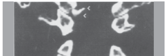
Figura 3. Fratura tipo III.